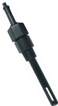
[ Model : 1403 ] [ 고농도용 ]