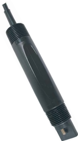
[ Model : 1407 ] [ 일반용 ]